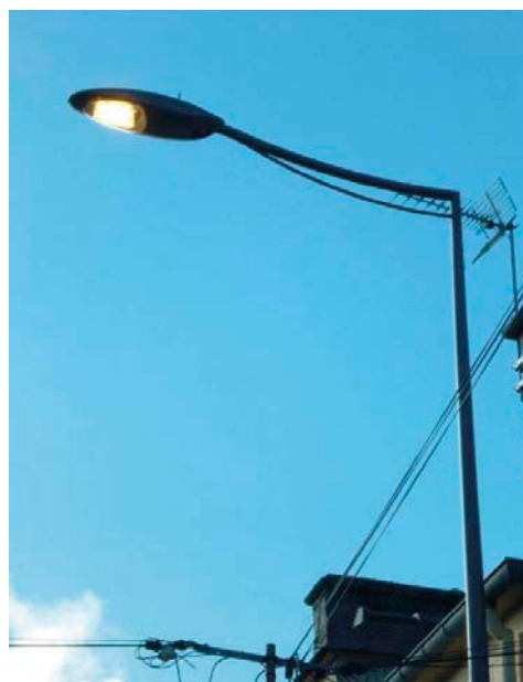
Commune de Quettehou.