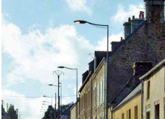
Commune de Quettehou.

L'aide de l'ADEME a permis d'abaisser le temps moyen de retour sur investissement pour une